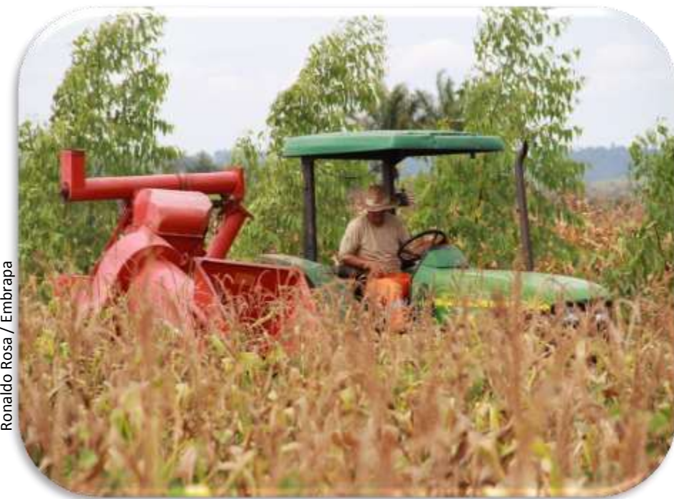
Ronaldo Rosa / Embrapa